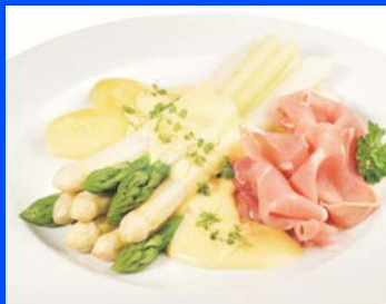
Spargel m. Räucherlachs